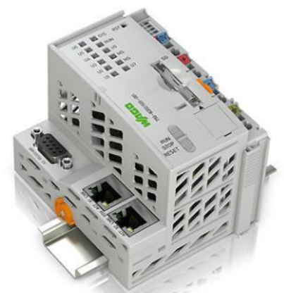
WAGO IPC 8202

Si un problème est détecté sur la centrale, un message est envoyé au support pour indiquer l'erreur et permettre de la réparer dans les plus brefs délais.