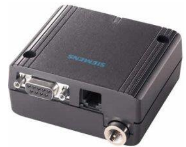
Module GSM Siemens MC35 i

Des interventions doivent alors être souvent faites pour changer les numéros de téléphone ou ajouter des alarmes. Ceci fait faire beaucoup de trajets pour une intervention très rapide. Les maisons sont situées dans toute la Suisse Romande, mais la plupart sont sur l'arc lémanique.