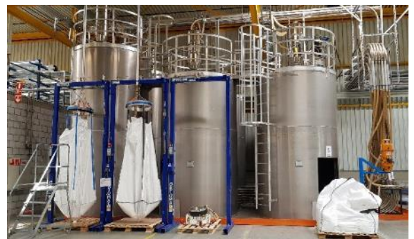
Silos de stockage

Une gestion des alarmes sera aussi effectuée. Elles devront être enregistrées dans les serveurs MES de l'entreprise.